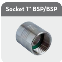
Socket 1" BSP/BSP