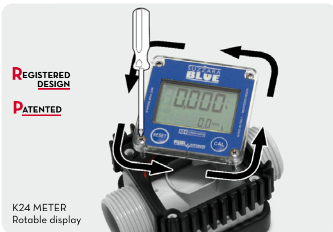
K24 METER Rotable display