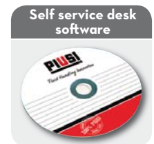
Self service desk software