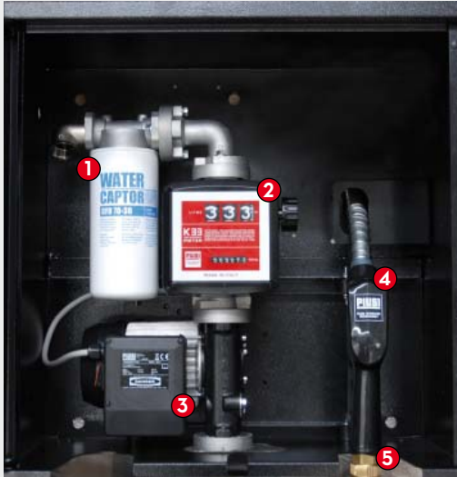
ST BOX Basic