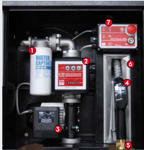
ST BOX Pro